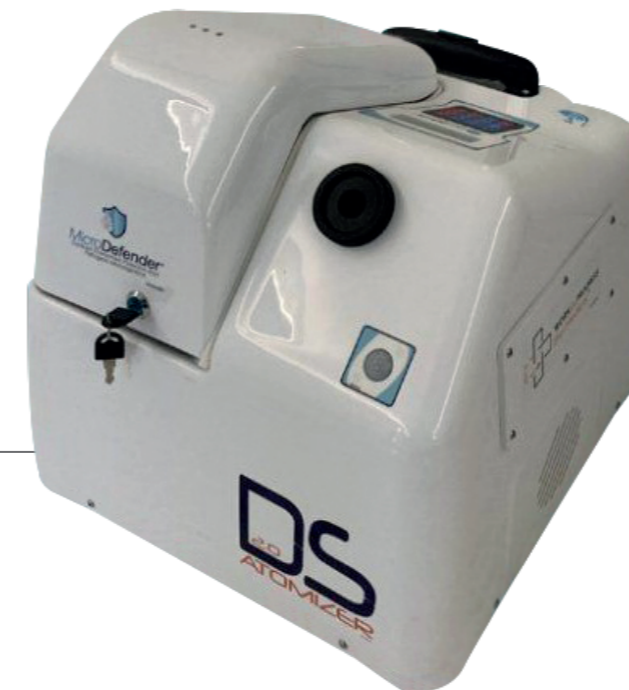
MICRODEFENDER 2.0 - DESINFEKTION & HYGIENISIERUNG MITTELS KALTVERNEBELUNG, KUNSTSTOFFGEHÄUSE Art. Nr. 39110563