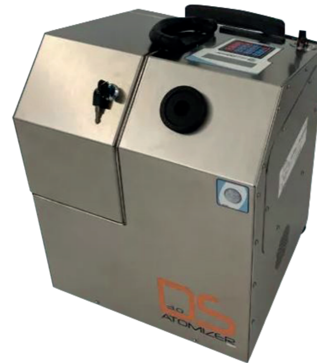
MICRODEFENDER 3.0 - DESINFEKTION & HYGIENISIERUNG MITTELS KALTVERNEBELUNG, EDELSTAHLGEHÄUSE Art. Nr. 39110560